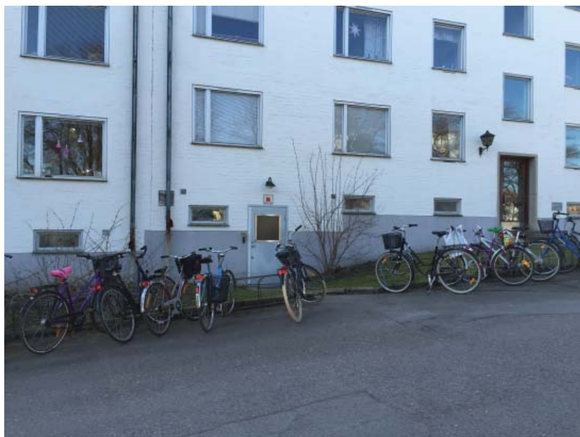
Exempel på befintliga fönster. Nuvarande fönster är 2-glasfönster i trä som på 80-talet blev inklädda med aluminiumplåt på utsidan.