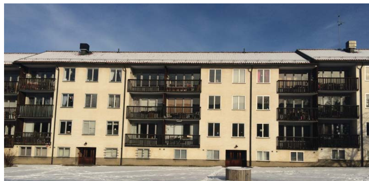
Befintliga balkonger med träräcken på hus N, O och P