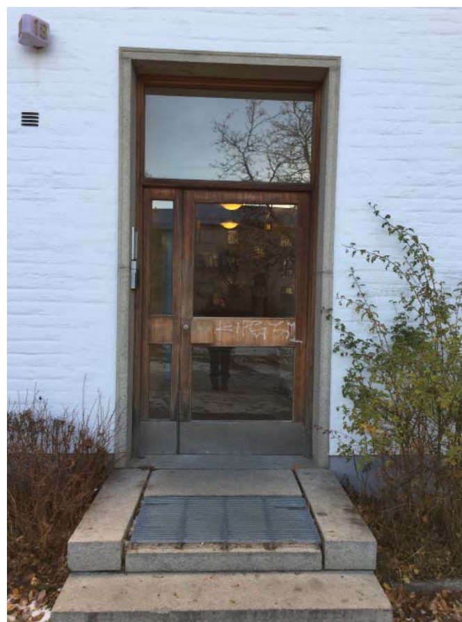
Exempel på befintliga entréportar i punkthusen