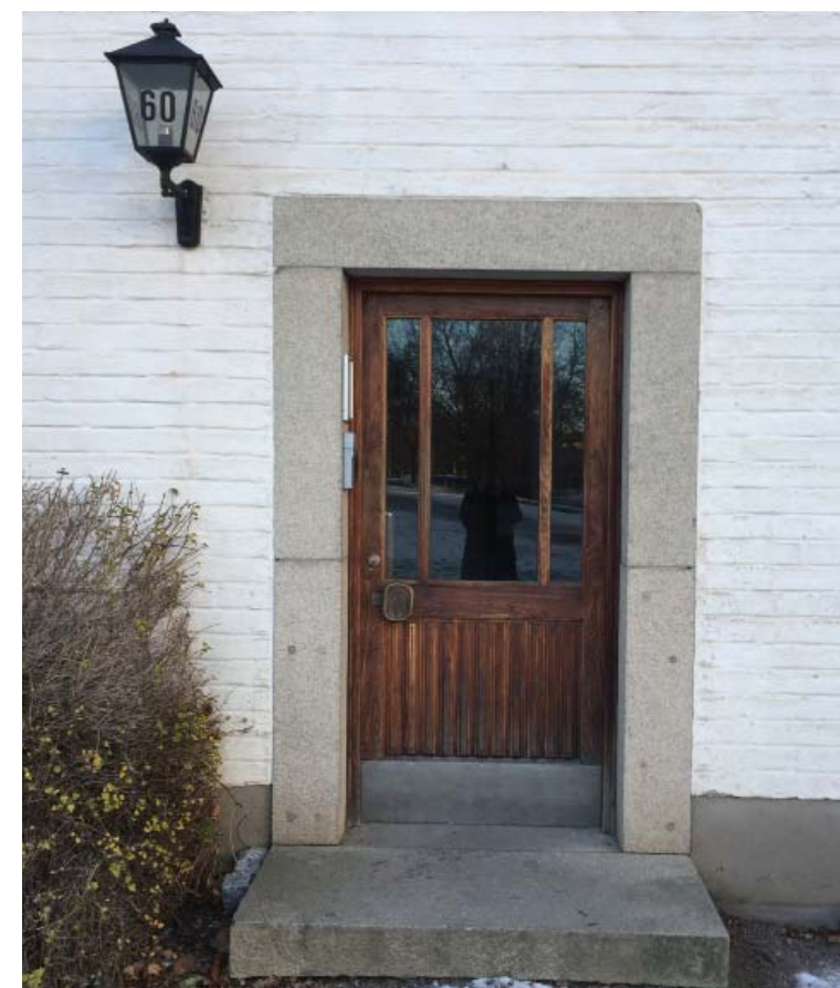
Exempel på befintliga entréportar i hus N, O och P