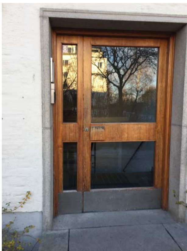
Exempel på befintliga entréportar i hus A, B och G Ytskikt av teakfanér och sparkplåt av rostfri plåt