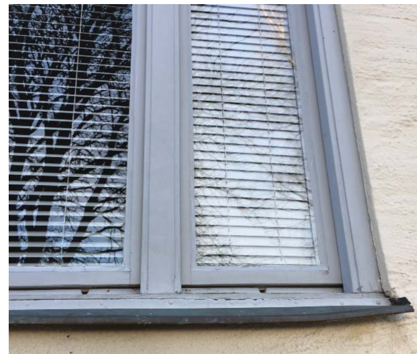
På hus J finns originalfönsterna kvar i trä. Karmbredd ca 50 mm, fönsterbåge inkl kittfals ca 30 mm. Mittpost bredd ca 75 mm.