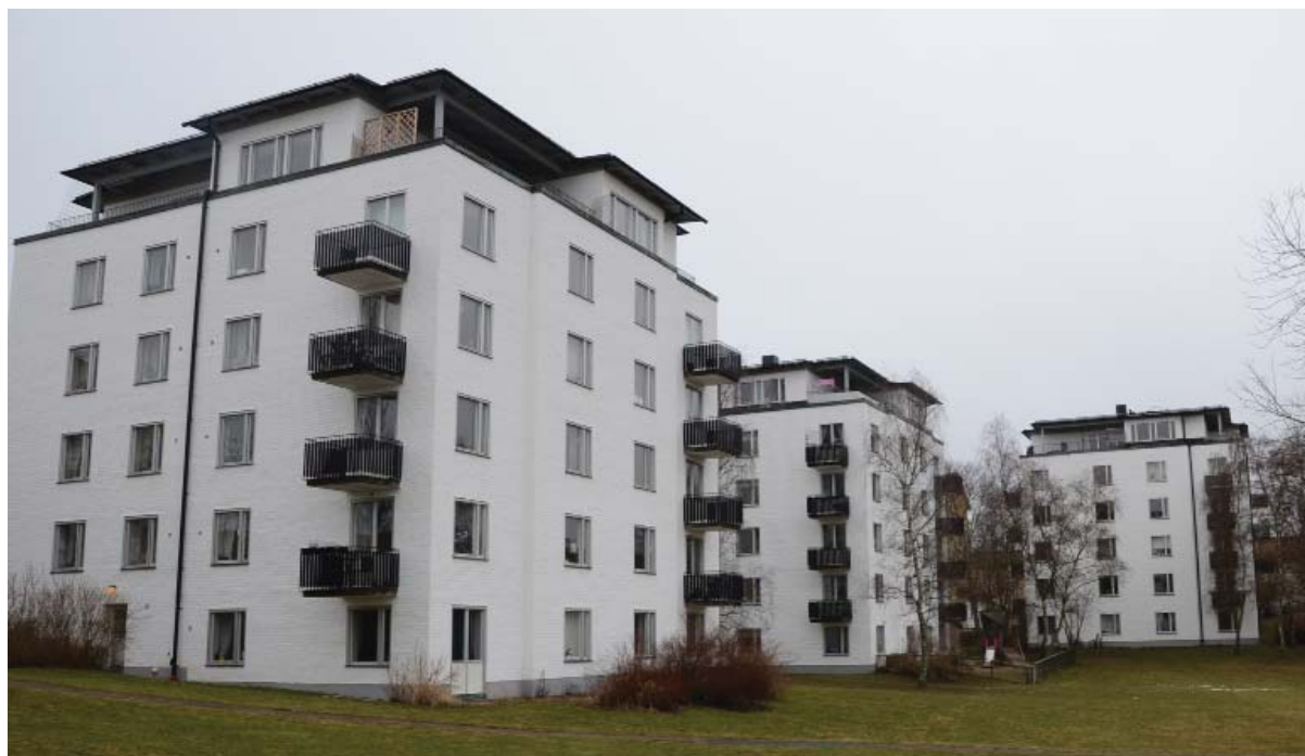
Befintliga balkonger med svarta smidesräcken på punkthus C, D, E, F, K och L